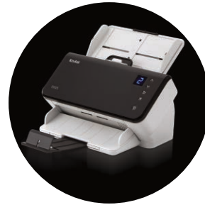
Scanner Kodak E1025 e E1035

* La velocità di elaborazione può variare in base al software applicativo, al sistema operativo e al PC in uso, oltre che alle funzioni di elaborazione immagini selezionate.